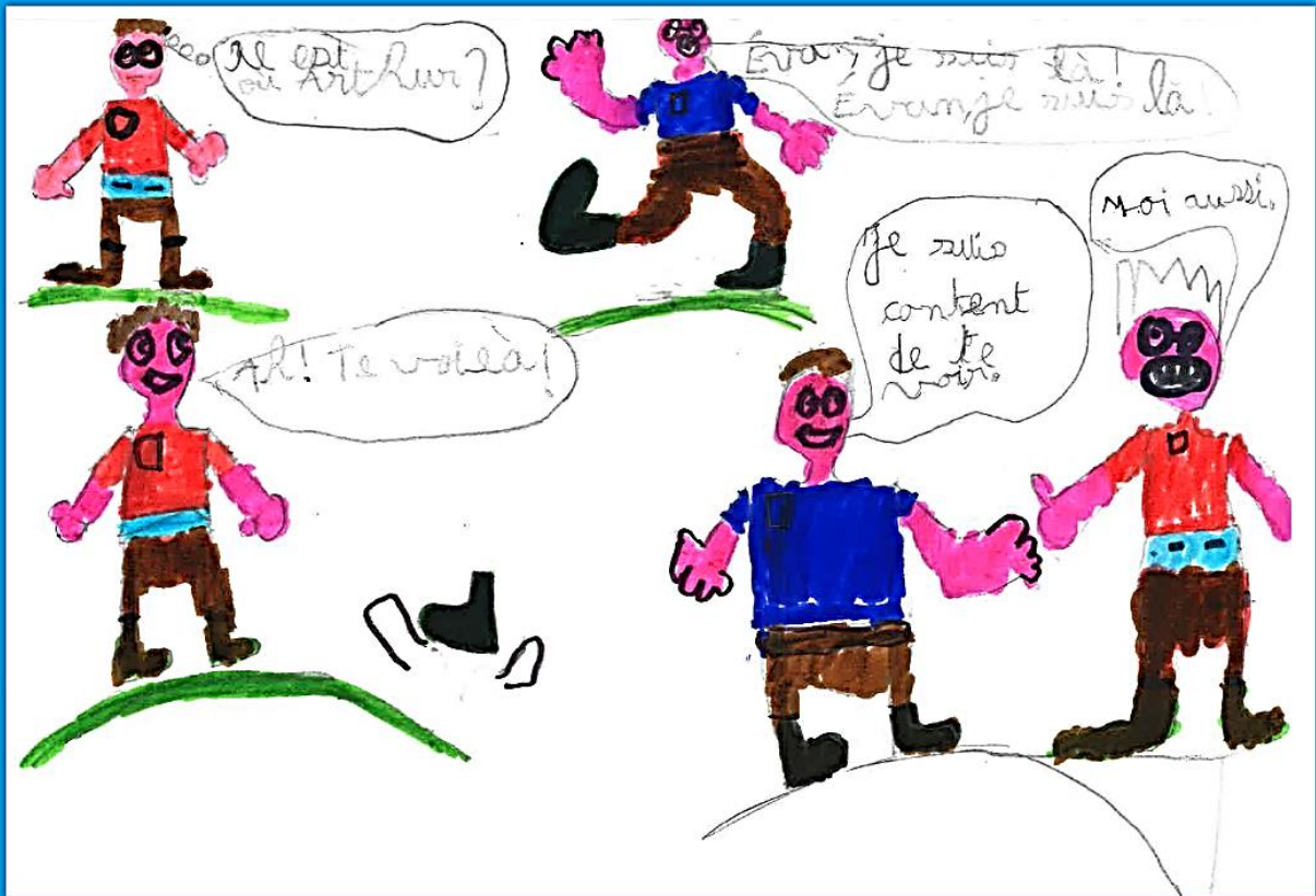
BD réalisée par Thomas, ULIS