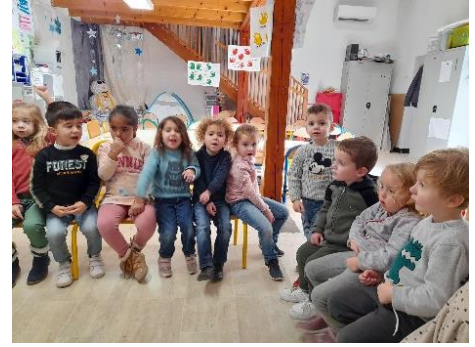
Réflexion et élaboration de notre liste de courses à faire avant l'atelier cuisine !