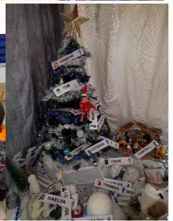
Fabrication de trois objets de Noël, d'une carte de vœux et des zézettes de Bouillargues !