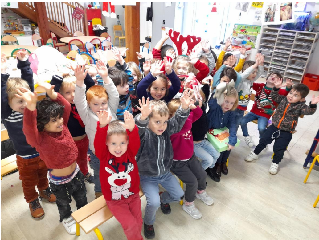
La classe des PS.